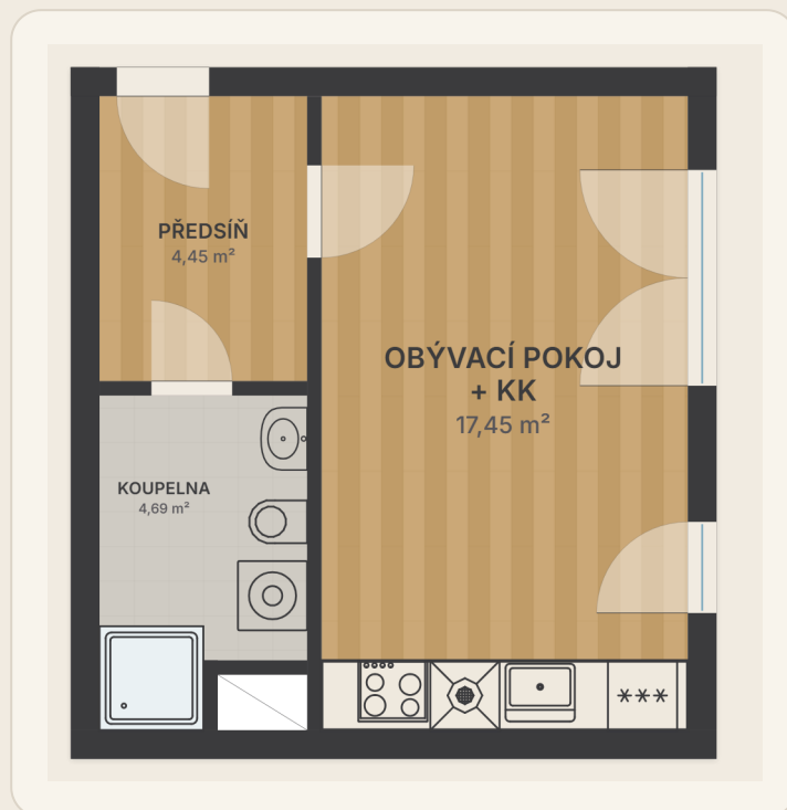
UMÍSTĚNÍ V PODLAŽÍ · 4.NP